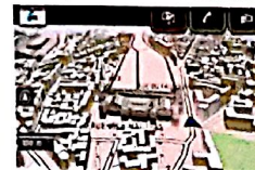
Mirror link con Navigatore