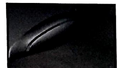
Sedili in pelle e microfibra riscaldabili