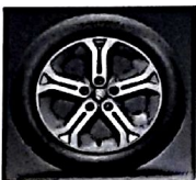
Cerchi da 17" Antracite