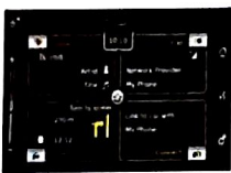
Touch screen + Mirror Link