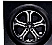
Cerchi in lega da 17" BiColor