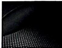
Sedili in tessuto con impunture