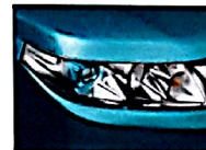
Fari a LED